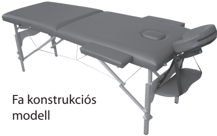
Fa konstrukciós modell