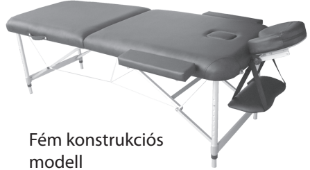
Fém konstrukciós modell